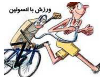
ورزش با انسولین

☠ اگر هنگام دوچرخه سواری احساس سرگیجه می کنید بهتر است پیاده روی را انتخاب کنید.